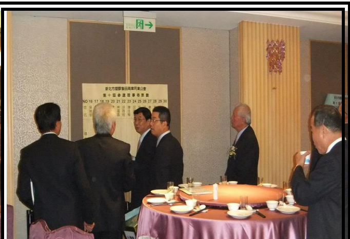
會員大會選舉理事：開票、記票。