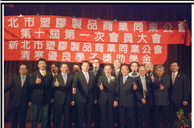
第十屆當選之理事長、理監事合影。